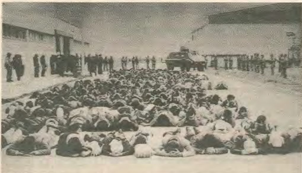
Πρωτομαγιά του 84 στην Κωνσταντινούπολη. Μόνο με χούντες και πραξικοπήματα μπορεί το κεφάλαιο να καθυστερήσει την σοσιαλιστική επανάσταση στη Τουρκία.

Φωνάζουν οι Έλληνες αστοί: η Κύπρος δίνει σήμερα τον «καλο αγώνα» του Ελληνισμού, συνεχίζει την τελεφταία μάχη των «Παλαιολόγων», να την βοηθήσουμε. Και όμως. Την εποχή του ιμπεριαλισμού δεν μπορούμε να μιλούμε για βοήθεια και συμπαράσταση. Ακόμα και αν υπάρχουν αυτά είναι απλά, ο τρόπος με τον οποίο εμφανίζεται η ΔΙΕΚΔΙΚΗΣΗ ενός ζωτικού χώρου. Λοιπόν όταν ο ελληνικός εμπορικός στόλος με χωρητικότητα 39.5 εκατ. κόρους απασχολεί πάνω από 100.000 Έλληνες ναυτεργάτες και αποτελεί το 15% του παγκόσμιου στόλου, τότε πρέπει να δούμε τα πράγματα και λίγο αλλιώς. Όταν αυτός ο στόλος δεν ασχολείται μόνο με το ελληνικό εξωτερικό εμπόριο αλλά κυρίως με τις μεταφορές μεγάλων μονοπωλιακών συγκροτημάτων της παγκόσμιας αστικής αγοράς, όταν το 1/3 αυτού του στόλου είναι πετρελαϊκά οφόρα που ασχολούνται με την μεταφορά πετρελαίου της Εγγυς Ανατολής, όταν οι ιδιοκτήτες αυτών των πετρελαϊκών οφόντων είναι την ίδια στιγμή οι μεγαλύτεροι εφοπλιστικοί οίκοι της Ελλάδας, όταν το ναφτιλιακό κεφάλαιο ελέγχει ισχυρές θέσεις μέσα στη βιομηχανία και τις τράπεζες, όταν οι Έλληνες εφοπλιστές είναι μέλη και συναιτέροι του παγκόσμιου κοσμοπολιτι-